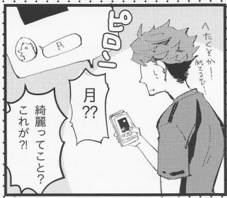
月、うまく写真とれないうまね...